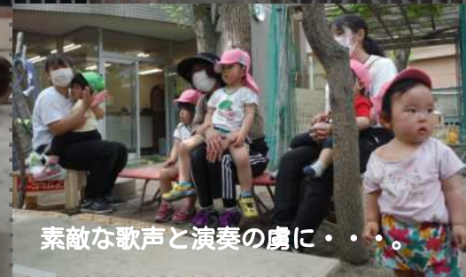
素敵な歌声と演奏の虜に・・・。

たそがれコンサートで自分たちが歌った曲が始まると一緒に歌ったり、身体を揺らして手拍子をしたりして楽しむ子どもたち！ 「どんな色が好き？」の曲をリクエストして、自分の好きな色を歌詞に入れて、みんなで歌いました。 演奏後、実際に楽器に触れ合う機会があり、使い方を教えてもらったり、園にない楽器にも出会いととてもいい機会でしたよ。