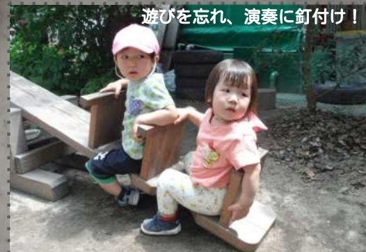
遊びを忘れ、演奏に釘付け！